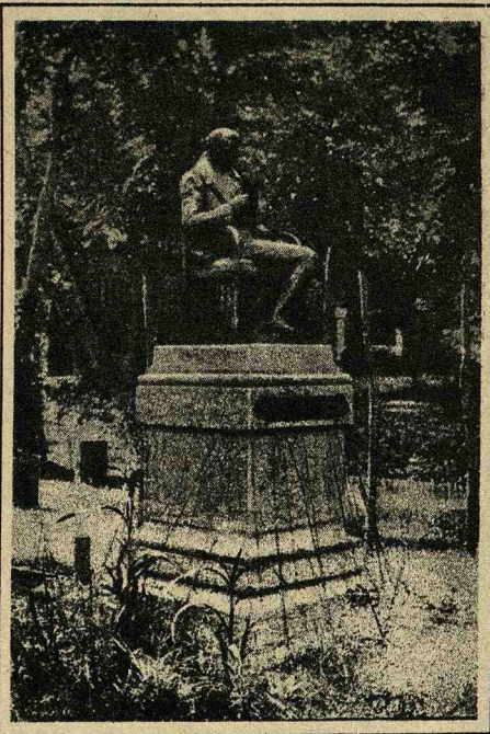
Памятник А. С. Грибоедову в Тегеране

советской власти. Конечно, иначе и не может быть. Конечно, частная собственность еще существует. Дух мещанства, по свидетельству Ленина, еще в высшей степени живуч. Все грязные пороки индивидуализма не изжиты. Ленин призывал к изжитию их и надеялся только на то, что процесс начался теперь с большей устремленностью и что всем этим чудовищам действительно не удастся устоять перед